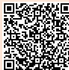
申込画面二次元コード

二次元コードを読み取れない場合は、群馬県ホームページ（ https://www.pref.gunma.jp/page/189638.html ）から申込画面を開いてください。